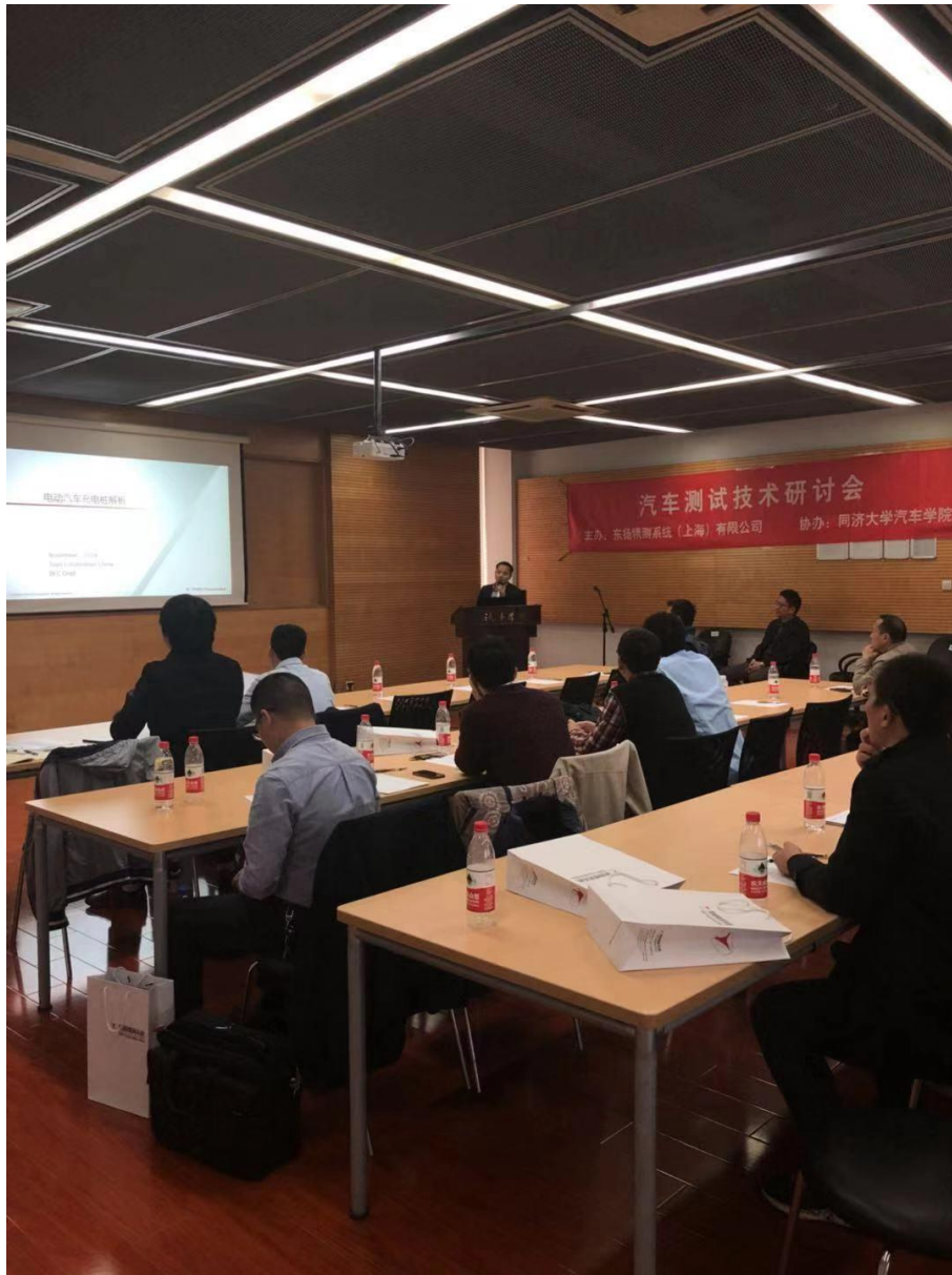
我司 BFC 部刘经理针对新能源汽车领域充电相关的测试方法进行了演讲。