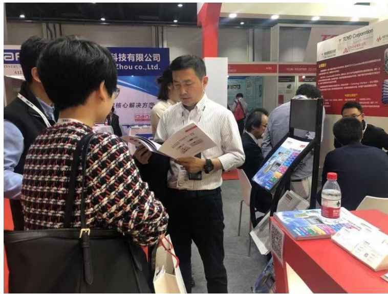
李部长亲自对接客户