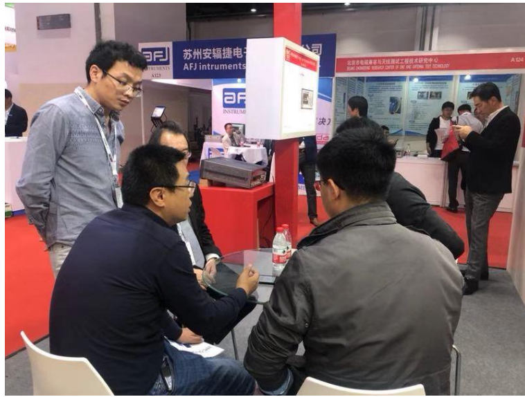
客户至我司展台深度交流