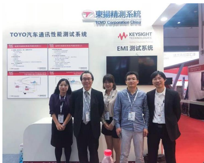
展会工作人员合影

据参加过多次本展会的同事反映，本届展会的规模、效应好于往届。我们也衷心地希望各位新老客户，在遇到 EMC 问题时，在 EMC 方案规划时，在 EMC 系统建设时，都能记住：我们“东扬精测系统”，永远是您得力的最佳合作伙伴！