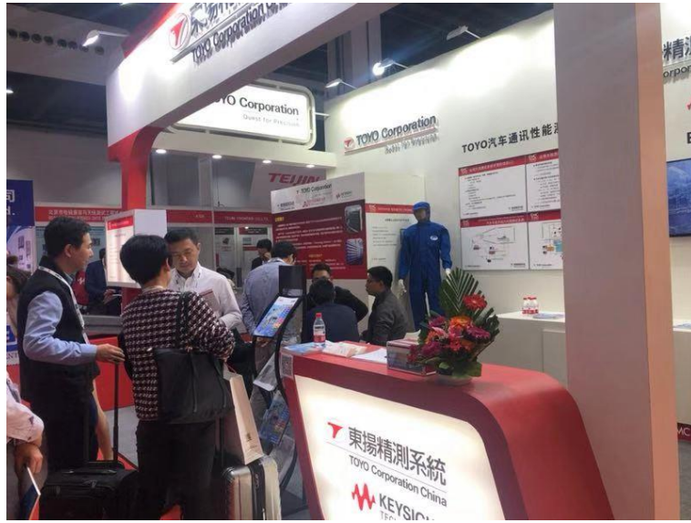
我司展台客户交流不断